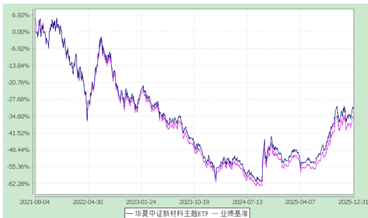
华夏中证新材料主题交易型开放式指数证券投资基金 份额累计净值增长率与业绩比较基准收益率历史走势对比图 (2021年8月4日至2025年12月31日)