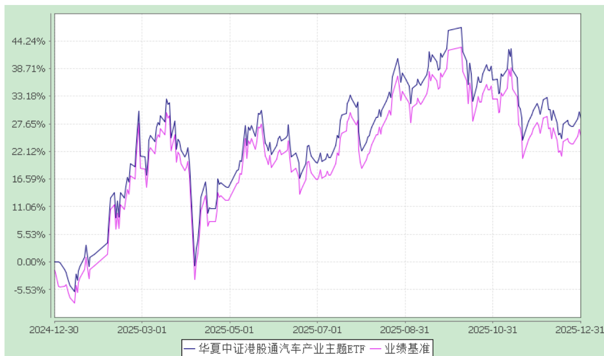
华夏中证港股通汽车产业主题交易型开放式指数证券投资基金 份额累计净值增长率与业绩比较基准收益率历史走势对比图 (2024 年 12 月 30 日至 2025 年 12 月 31 日)

注：根据本基金的基金合同规定，本基金自基金合同生效之日起 6 个月内使基金的投资组合比例符合本基金合同中投资范围、投资限制的有关约定。