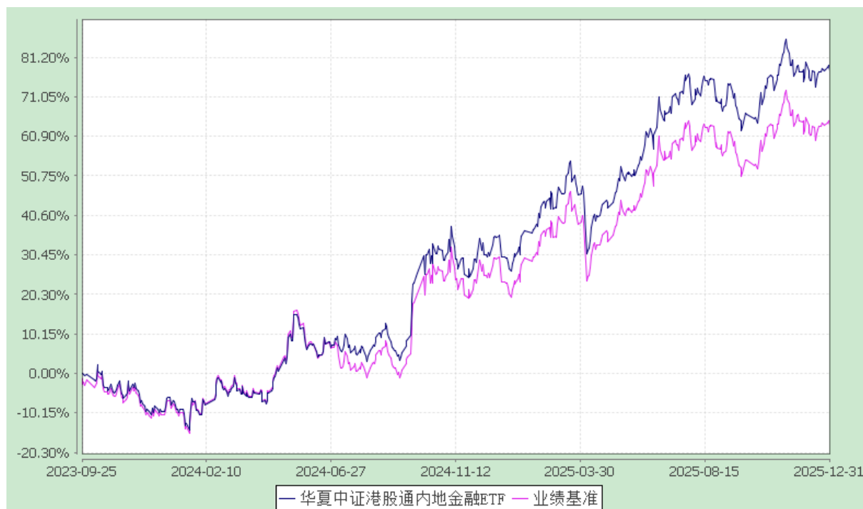
华夏中证港股通内地金融交易型开放式指数证券投资基金 份额累计净值增长率与业绩比较基准收益率历史走势对比图 (2023年9月25日至2025年12月31日)