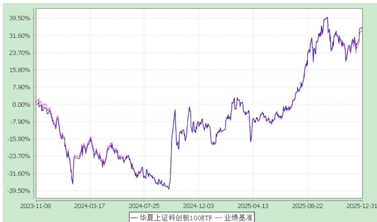
华夏上证科创板 100 交易型开放式指数证券投资基金 份额累计净值增长率与业绩比较基准收益率历史走势对比图 (2023 年 11 月 8 日至 2025 年 12 月 31 日)