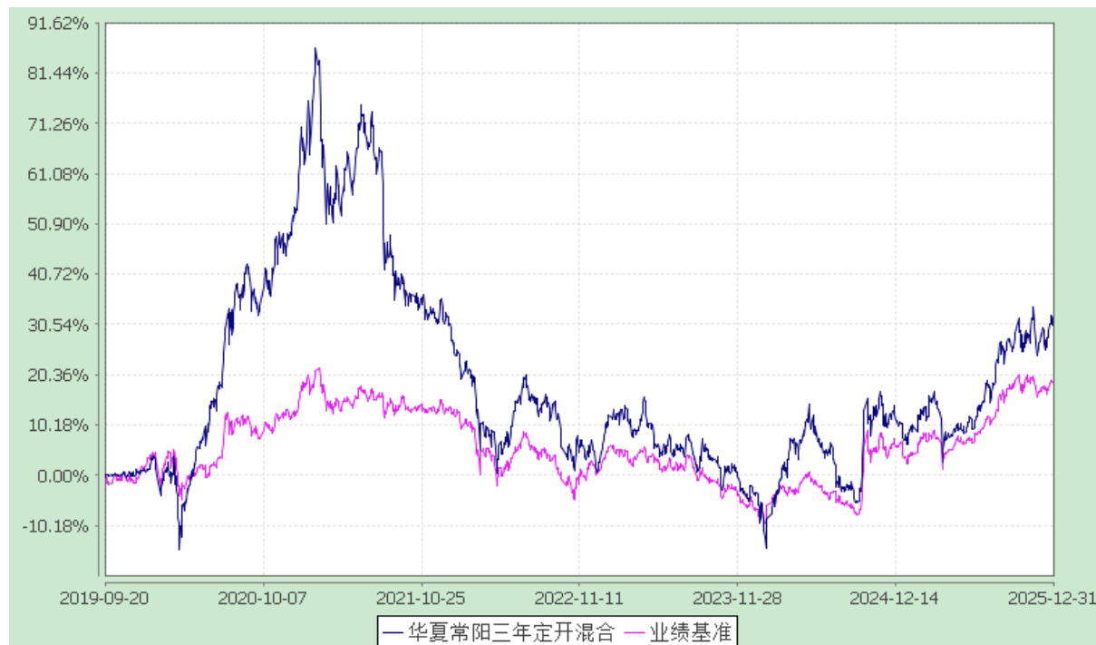
华夏常阳三年定期开放混合型证券投资基金 份额累计净值增长率与业绩比较基准收益率历史走势对比图 (2019年9月20日至2025年12月31日)