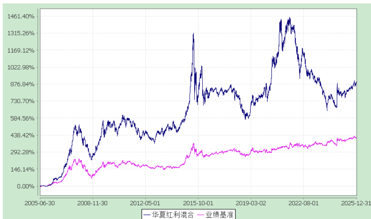
华夏红利混合型证券投资基金 份额累计净值增长率与业绩比较基准收益率历史走势对比图 (2005年6月30日至2025年12月31日)