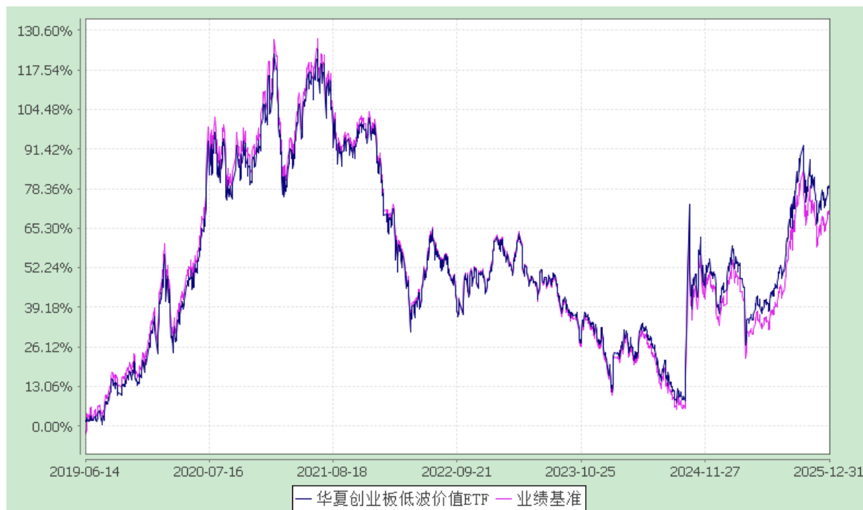
华夏创业板低波价值交易型开放式指数证券投资基金 份额累计净值增长率与业绩比较基准收益率历史走势对比图 (2019 年 6 月 14 日至 2025 年 12 月 31 日)