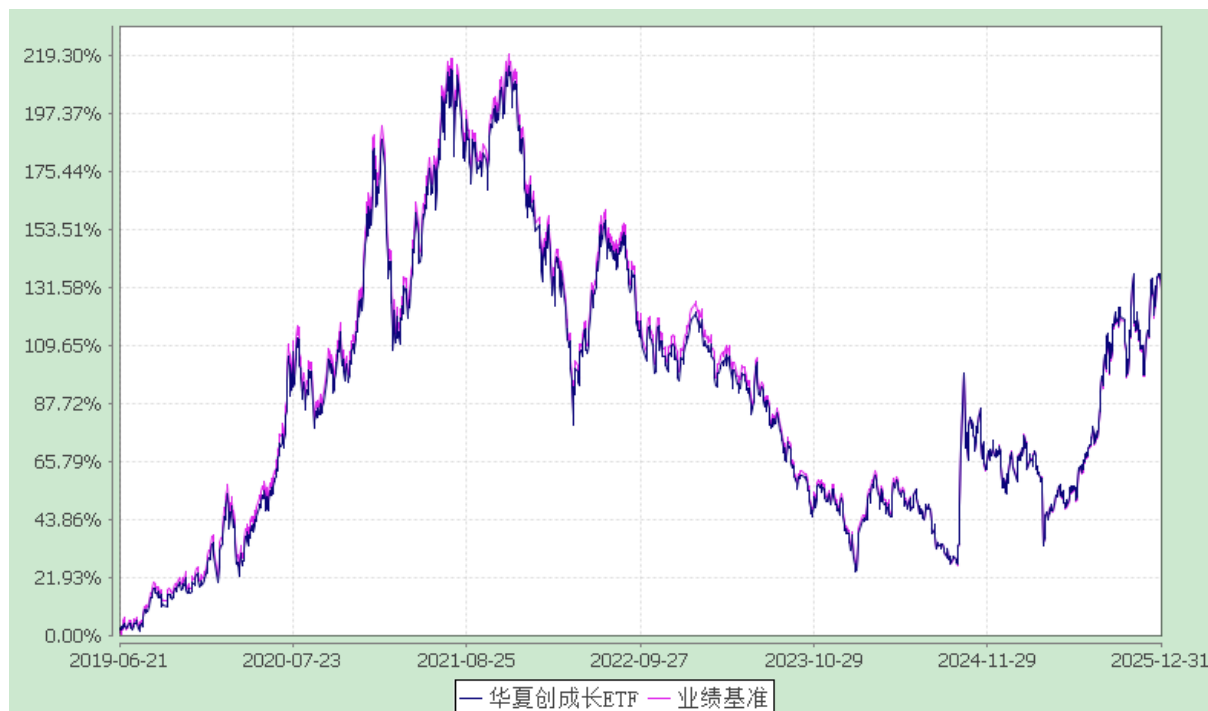
华夏创业板动量成长交易型开放式指数证券投资基金 份额累计净值增长率与业绩比较基准收益率历史走势对比图 (2019 年 6 月 21 日至 2025 年 12 月 31 日)