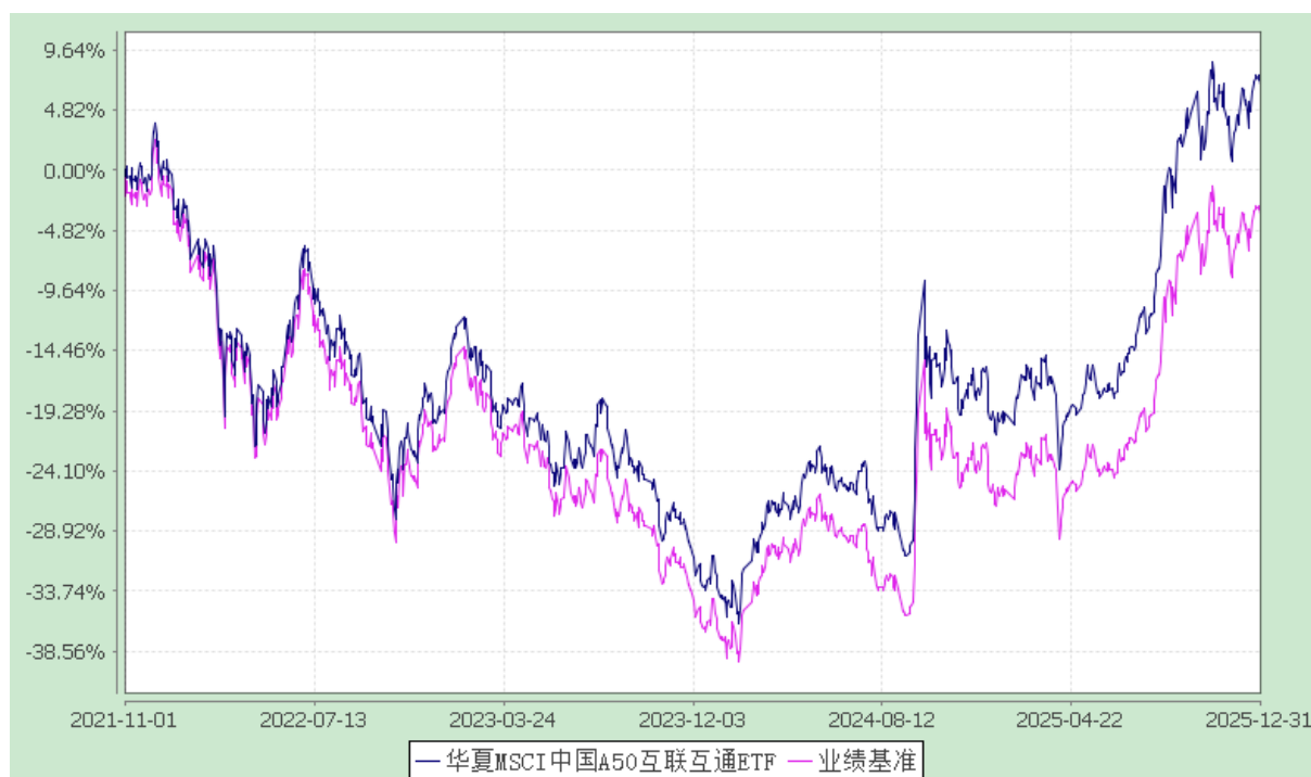
华夏 MSCI 中国 A50 互联互通交易型开放式指数证券投资基金 份额累计净值增长率与业绩比较基准收益率历史走势对比图 (2021 年 11 月 1 日至 2025 年 12 月 31 日)